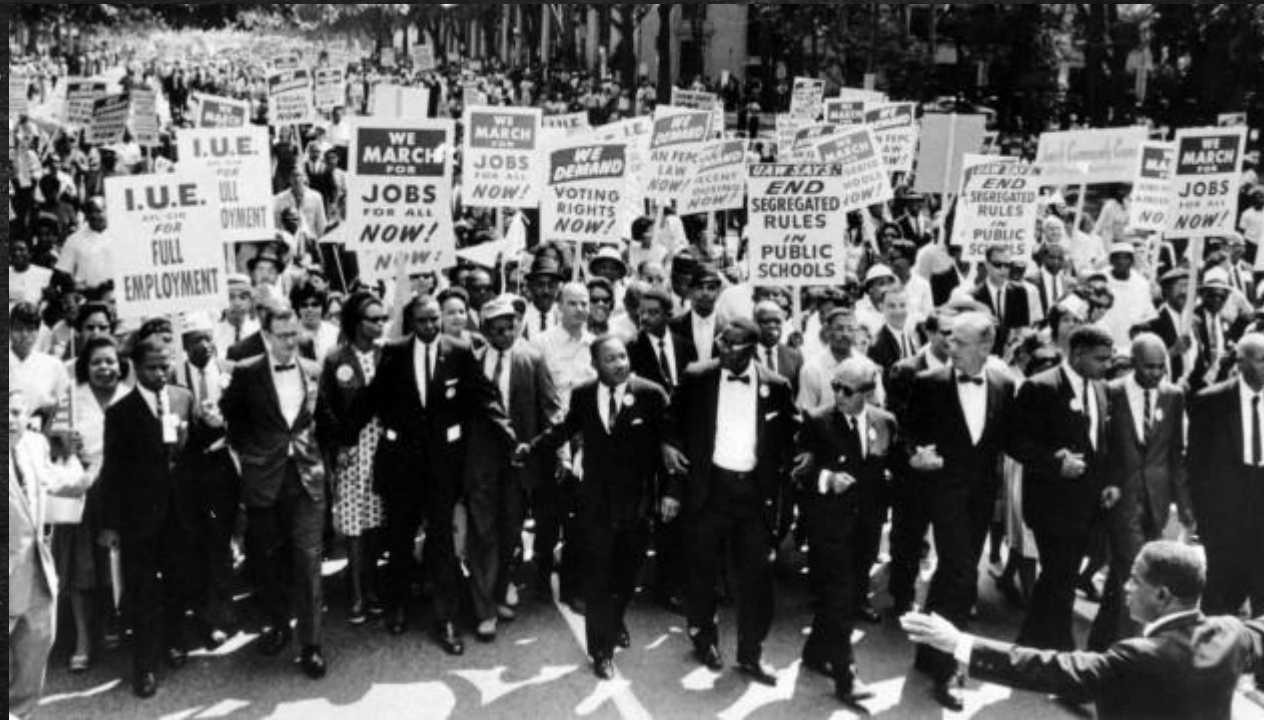
March on Washington 1963