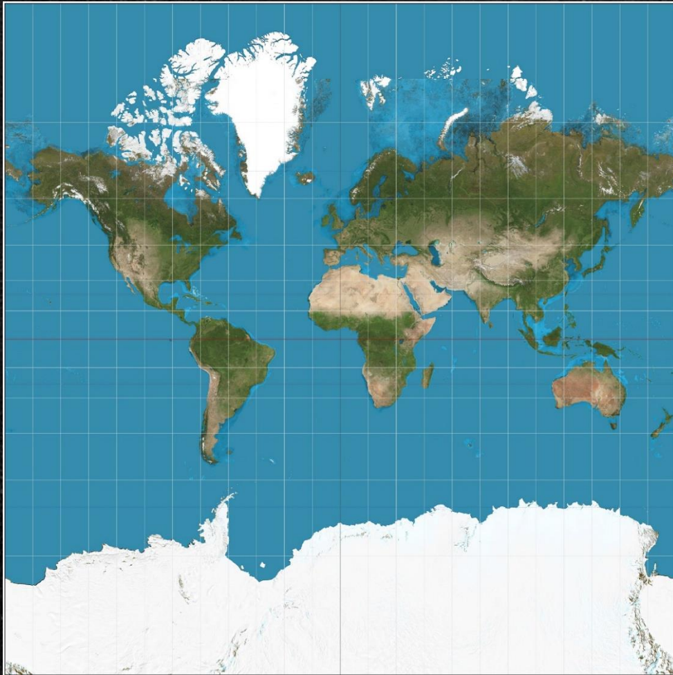
Mercator projection by Strebe - Own work, CC BY-SA 3.0,